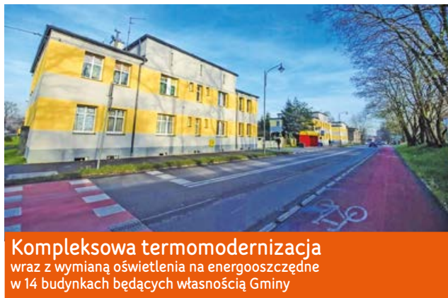
Kompleksowa termomodernizacja wraz z wymianą oświetlenia na energooszczędne w 14 budynkach będących własnością Gminy

Usunięcie namotu, doprowadzenie deszczówki, modernizacja oświetlenia Alei Spacerowej, wykonanie błoni, posadowienie budynku gospodarczego.