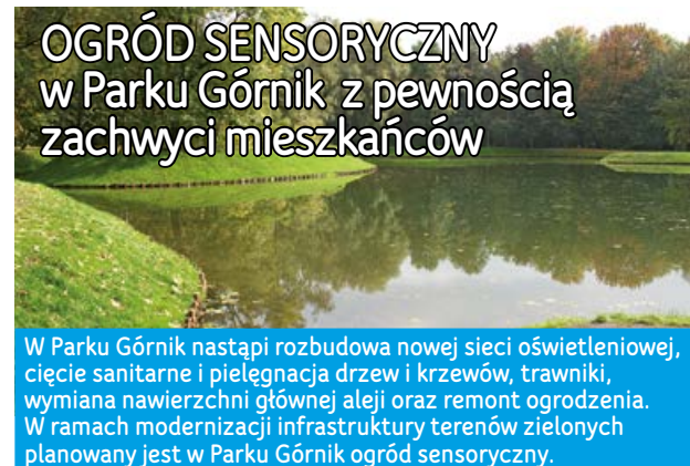
OGRÓD SENSORYCZNY w Parku Górnik z pewnością zachwyci mieszkańców

W Parku Górnik nastąpi rozbudowa nowej sieci oświetleniowej, cięcie sanitarne i pielęgnacja drzew i krzewów, trawniki, wymiana nawierzchni głównej alei oraz remont ogrodzenia. W ramach modernizacji infrastruktury terenów zielonych planowany jest w Parku Górnik ogród sensoryczny.