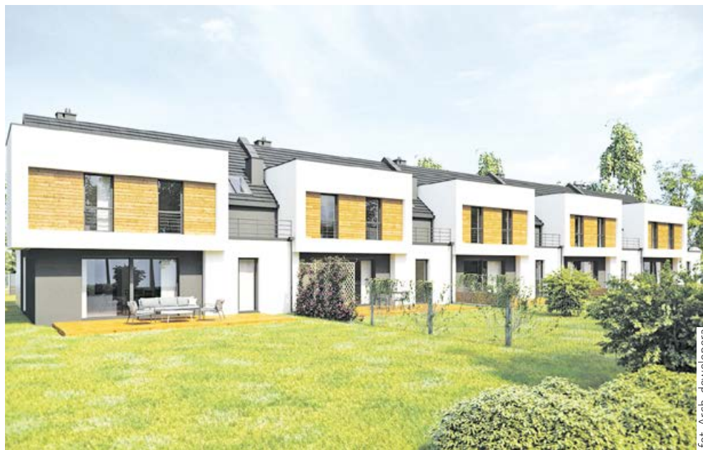
„Zielony Zakątek” zlokalizowana przy ulicy Spokojnej

W dzielnicy Michałkowice powstaje nowe osiedle mieszkaniowe – Osiedle Dębowy Park (Adatex Sp. z o.o.), przy ulicy Oświęcimskiej obok Parku Górnik. Osiedle Dębowy Park to idealne miejsce dla osób niezależnych, które pracując w dużym mieście pragną mieszkać z dala od miejskiego zgiełku, blisko przyrody i jednocześnie na tyle blisko centrum, aby nadal mieć dogodny dostęp do atrakcji dużego miasta. Nowa inwestycja w Siemianowicach Śląskich to kompleksowo zaplanowana przestrzeń miejska, składająca się z 11 budynków mieszkalnych. Przyszli mieszkańcy będą mogli, oprócz funkcjonalnych i komfortowych mieszkań, liczyć również na przemyślaną infrastrukturę osiedlową, między innymi miejsca postojowe zewnętrzne oraz parkingi podziemne, a także na ciekawe otoczenie wokół ich miejsca zamieszkania.