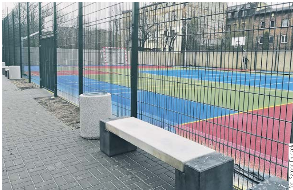
fol. Szmon Ducek