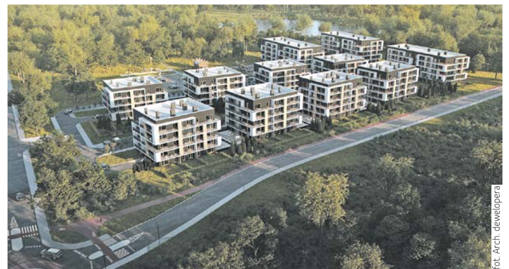
Osiedle Dębowy Park, przy ulicy Oświęcimskiej, obok Parku „Górnik”

Duże nowoczesne osiedle domów jednorodzinnych o nazwie „Jaśminowe Pola” (KAMSOFT/KAMBUD) powstaje w Siemianowicach Śląskich przy ulicy Bańgowskiej.