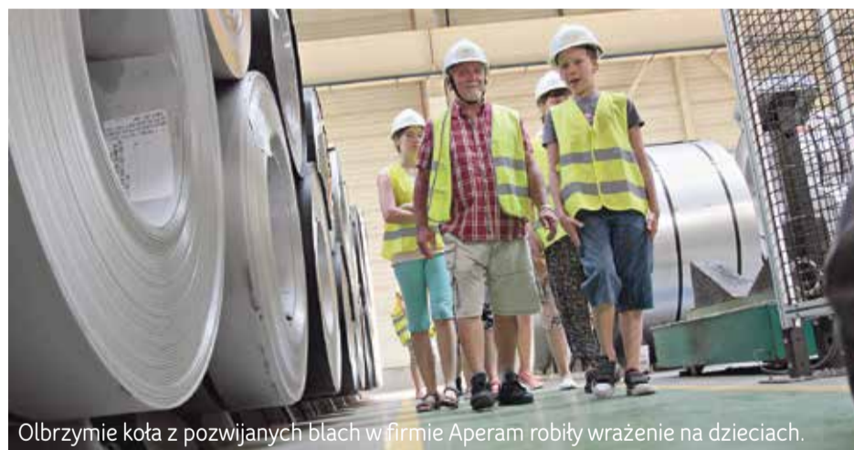
Olbrzymie koła z pozwijanych blach w firmie Aperam robiły wrażenie na dzieciach.