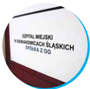
Przekształcenie w spółkę z o.o. 12.12.2013 r.