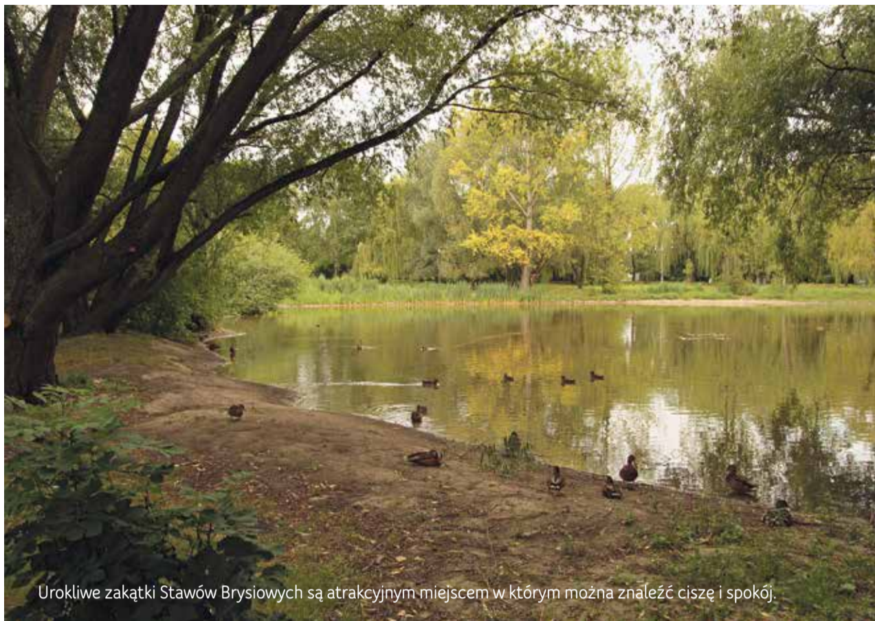
Urokliwe zakątki Stawów Brysiowych są atrakcyjnym miejscem w którym można znaleźć ciszę i spokój.