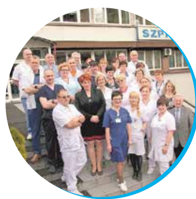
Szpital Miejski z gwarantowanym kontraktem i wpisany do tzw. Sieci Szpitali