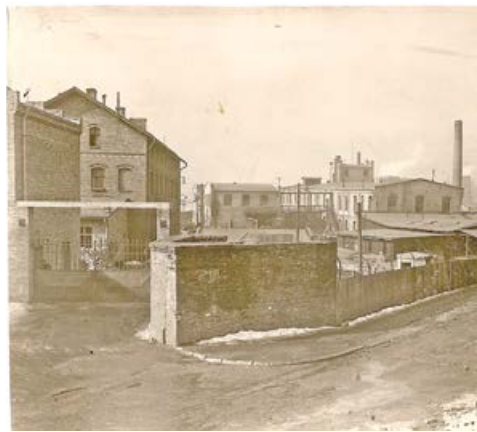
Katowickie Zakłady Naprawcze „Tereska”