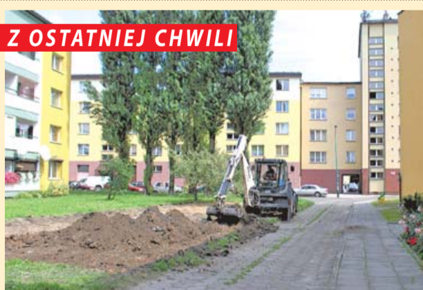
Ruszyła budowa parkingu na osiedlu Zawadzkiego przy ulicy Fojkisa. 9 miejsc parkingowych plus jedno dla niepełnosprawnych będzie do dyspozycji mieszkańców. Do końca lipca planowane jest zakończenie prac.

Miejski Ośrodek Pomocy Społecznej w Siemianowicach Śląskich informuje o wolnych miejscach w Dziennym Domu Pomocy Społecznej w Siemianowicach Śląskich przy ul. Św. Barbary 5. Przeznaczony dla osób starszych i niepełnosprawnych DDPS przez 7 dni w tygodniu zapewnia m.in.: dzienny pobyt, zajęcia rekreacyjne, kulturalne, usprawniające, wyżywienie. Więcej informacji na ten temat udzieli Dział Opieki nad Osobami Starszymi i Niepełnosprawnymi MOPS ul. Szkolna 17 pok. 11, tel. 32 765 62 11.