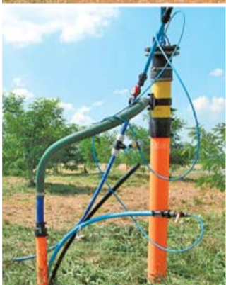
Firma Landeco w dalszym ciągu zajmuje się odzyskiwaniem gazu do produkcji energii, działa też sprawnie sortownia, gdzie przywożone śmieci zostają posortowane i zostają wywiezione poza nasze miasto.