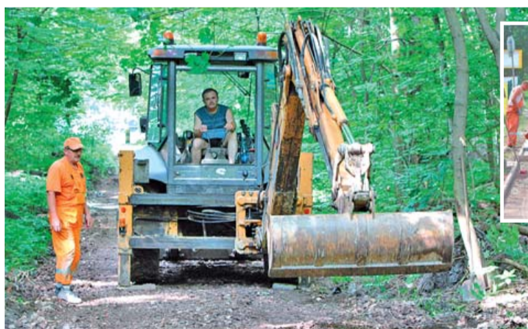
Nowym odcinkiem traktu rowerowego dojedziemy do granic miasta Czeladź.