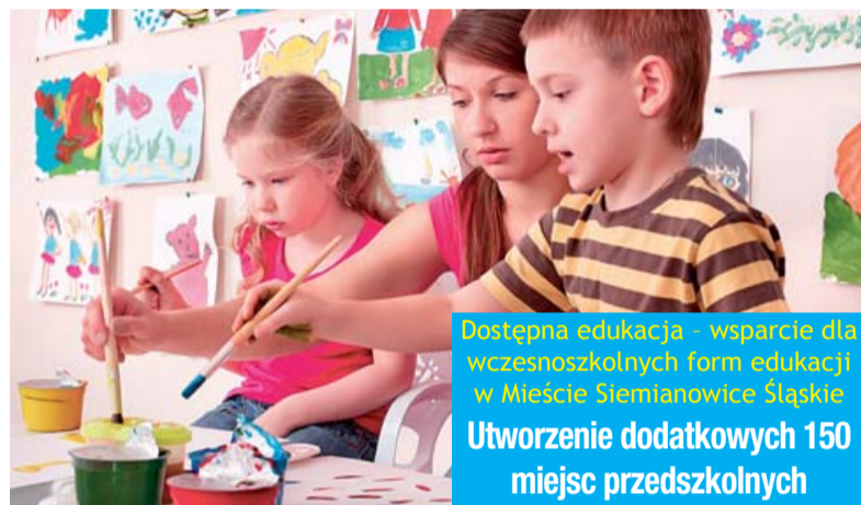
Dostępna edukacja - wsparcie dla wczesnoszkolnych form edukacji w Mieście Siemianowice Śląskie Utworzenie dodatkowych 150 miejsc przedszkolnych

Utworzonych zostanie 150 dodatkowych miejsc przedszkolnych, czyli 6 oddziałów. W praktyce przebudowany zostanie obecny budynek Gimnazjum nr 3 oraz zmodernizowany zostanie budynek Przedszkola Miejskiego nr 15. Oferta edukacyjna ma być poszerzona o zajęcia specjalistyczne wspomagające rozwój dzieci z dysfunkcjami rozwojowymi, dofinansowanie wydłużenia godzin pracy oraz zwiększenie obsługi personelu, integrację dzieci przedszkolnych z tymi, nie objętymi edukacją przedszkolną oraz ad-