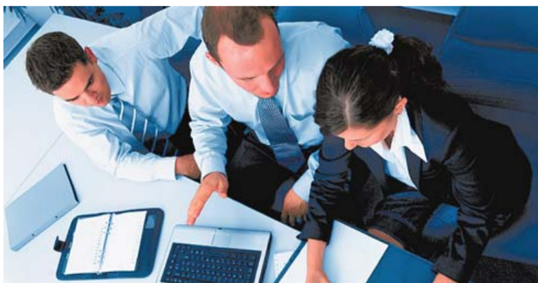
Siemianowicki Obszar Rewitalizacji Społecznej i Aktywności Lokalnej Rewitalizacja budynku miejskiego celem utworzenia Centrum Aktywizacji Zawodowej i Rewitalizacji Społecznej (CAZiR)

energii w budynkach użyteczności publicznej, walkę z niską emisją, wymiana oświetlenia miejskiego na energooszczędne, ochronę i wykorzystanie zasobów przyrodniczych miasta. Sfera rozwojowa planowanych przedsięwzięć obejmuje zaś m.in. wprowadzenie udogodnień dla rowerzystów, utworzenie nowych mieszkań, rewitalizację budynku miejskiego celem utworzenia Centrum Aktywizacji Zawodowej i Rewitalizacji Społecznej. Szczegóły?