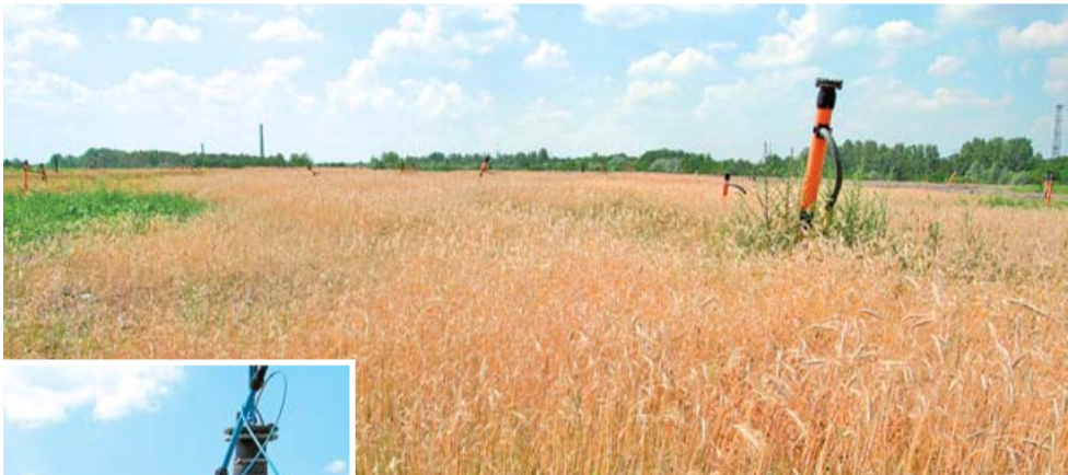
Tak wygląda dzisiaj teren wysypiska, gdzie jeszcze do niedawna wywrotki przywoziły śmieci. Za kilkanaście lat będą to tereny zielone przeznaczone pod rekreację.

Nie jest to proces krótkotrwały, ponieważ od podjęcia decyzji do jego zamknięcia, czyli chwili obecnej musiały zostać spełnione wymogi formalne i techniczne, aby w przyszłości nie pojawił się problem źle zabezpieczonego składowiska. Mogłoby to nawet grozić zanieczyszczeniem okolicznych gruntów. Teraz czeka nas rekultywacja tego terenu, czym w dalszym ciągu będzie zaj-