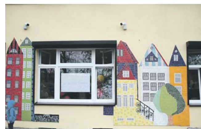
fol. Piotr Pindur