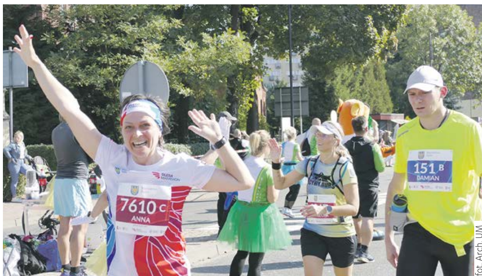
fol. Arch. UM