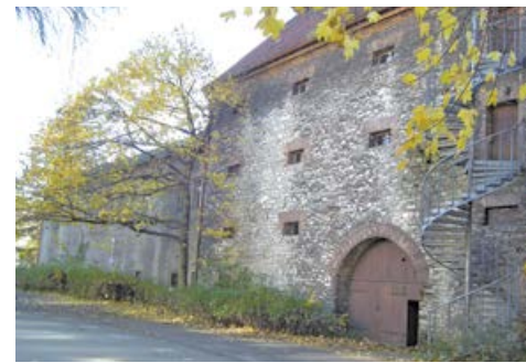
Muzeum Miejskie dziś

Od tego czasu zaczął się szybki rozwój placówki, czego punktem kulminacyjnym było powołanie do życia, uchwałą Rady Miejskiej w Siemiano-