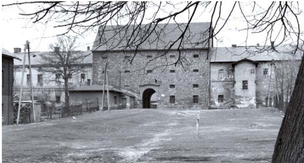
1983r. PGR w zabudowaniach gospodarczych pałacu