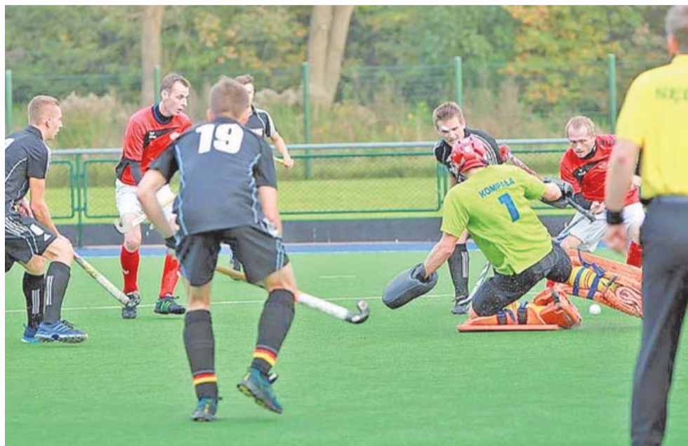
Hokeiści MKS Siemianowiczanki byli o krok od sprawienia sensacji w Gnieźnie - zabrakło doświadczenia, koncentracji i... szczęścia

Wówczas to gospodarzom po raz pierwszy udało się „złamać” defensywę gości. Nikt jednak nie spodziewał się, że będzie to początek dramatu siemianowiczanki, którzy wciąż przecie-