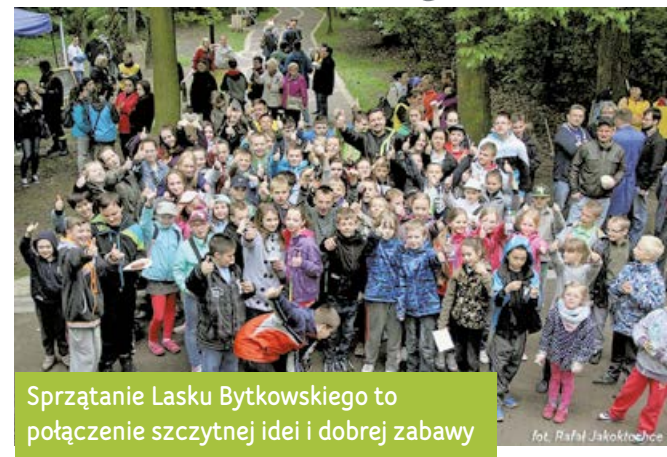
Sprzątanie Lasku Bytkowskiego to połączenie szczytnej idei i dobrej zabawy