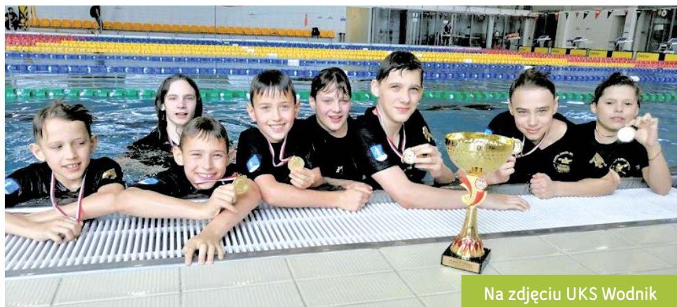
Na zdjęciu UKS Wodnik