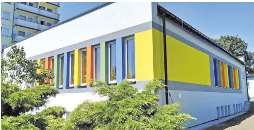
fol. Arch. UM