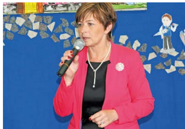
for Arch UM

Każdy nauczyciel dobrze wie, że czasem gorszy stopień jest znacznie więcej wart, niż najlepsza ocena, gdyż jest okupiony przez ucznia i nauczyciela nieporównanie większym wysiłkiem, niż w przypadku uzdolnionego kolegi, mającego na dodatek w rodzinnym domu wszechstronne wsparcie. Aktualnie wśród uczniów „szóstki” większość dzieci pochodzi z domów, w których nauka ma wartość, ale nie zawsze tak było. Tutejsze środowisko uczniowskie było