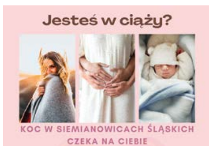
grafika: Szpital Miejski w Siemianowicach Śląskich