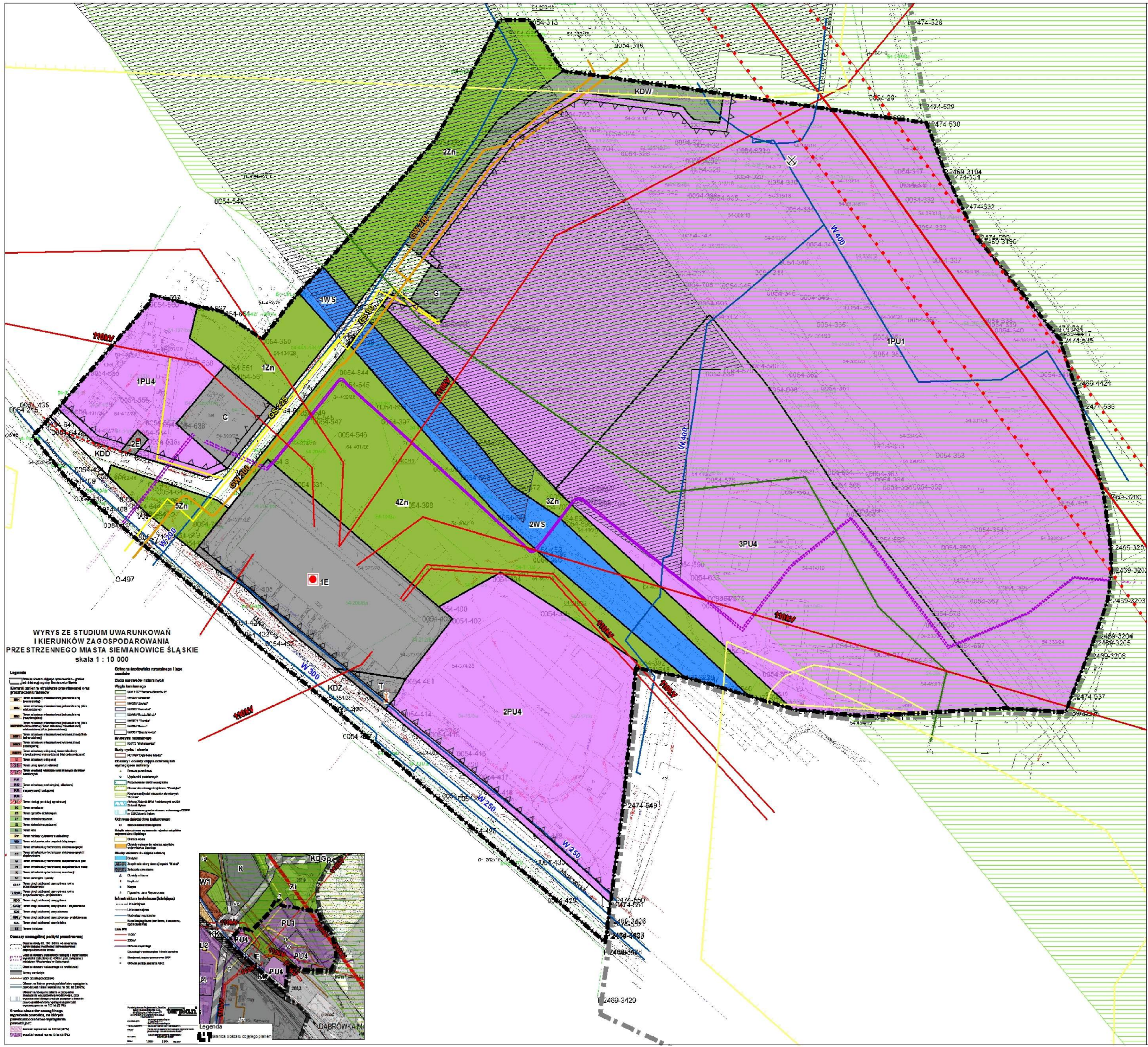
WYRYS ZE STUDIUM UWARUNKOWAŃ I KIERUNKÓW ZAGOSPODAROWANIA PRZESTRZENNEGO MIASTA SIEMIANOWICE ŚLĄSKIE skala 1 : 10 000