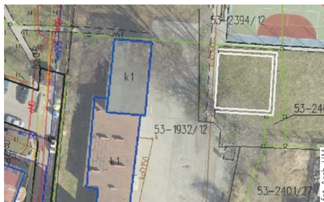
fol. Arch. UMi