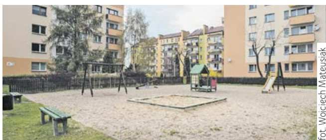
fol. Wojciech Mateusik

W tym roku w ramach Budżetu Obywatelskiego 2022 przewidziano realizację trzech placów zabaw. Umowa na modernizację placu zabaw przy ul. Gansińca została już podpisana. Budowa dwóch pozostałych, tj. przy Zespole Szkół Sportowych oraz Szkole Podstawowej nr 5 będzie możliwa po pozytywnym zakończeniu postępowania przetargowego.