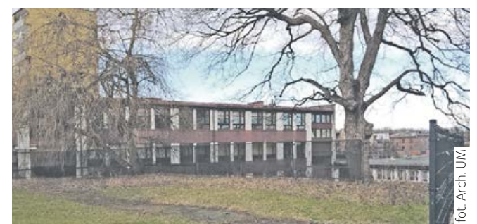
fol. Arch. UMi