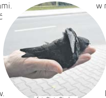
fol. Piotr Pindur