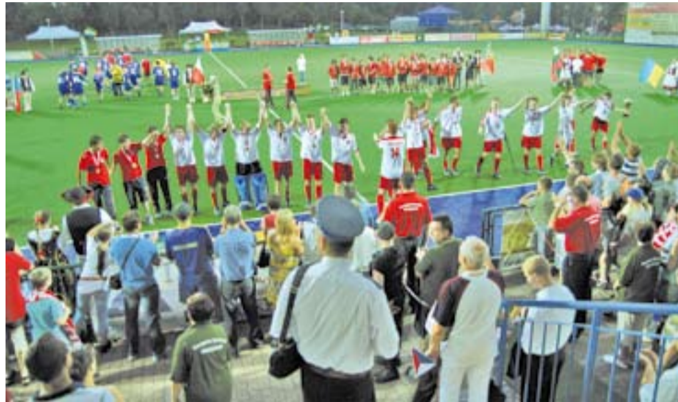
Kompleks Sportowy SIEMION od 10 lat jest teatrem sportowych emocji.

- W ciągu dekady gościli tu już trzykrotnie uczestnicy imprez hokejowych rangi mistrzostw Europy, odbyło się wiele innych turniejów międzynarodowych oraz reprezentacyjnych meczów międzypaństwowych. W Siemianowicach Śląskich gościli m.in. mistrzowie olimpijscy i mistrzowie świata – drużyna Niemiec, której mecz z Polakami był bezpośrednio transmitowany w TVP Sport. Kompleks Sportowy „Siemion” jest również areną międzynarodowych rozgrywek klubowych, turniejów finałowych w ramach Ogólnopolskiej Olimpiady Młodzieży oraz meczów hokejowej ekstraklasy. Na stadionie występowały drużyny w różnych kategoriach wiekowych, zarówno kobiet jak i mężczyzn. Przede wszystkim jednak na co dzień z obiektu korzystają hokeiści siemianowickich klubów, a najmłodszy adept hokeja na trawie mają dzięki temu komforto-