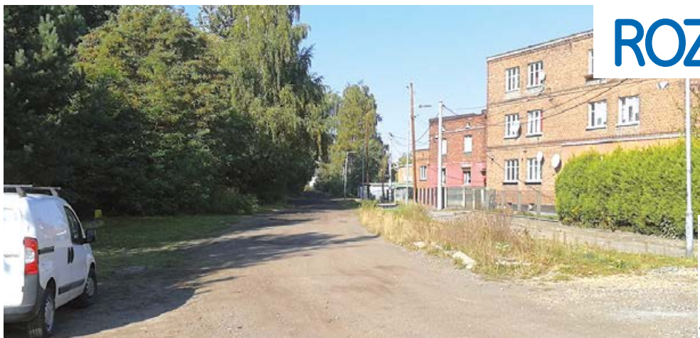
fol. Szymon Ducek